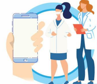
В СЛУЧАЕ ЗАБОЛЕВАНИЯ ОБРАЩАЙТЕСЬ К ВРАЧУ